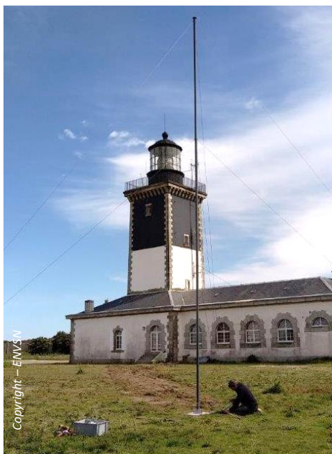
Phare de Pen Men – île de Groix