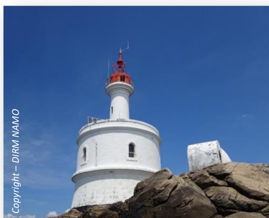
Phare de la Teignouse

Grace à des capteurs placés en mer et sur le littoral, le site internet www.windmorbihan.com donne des mesures de vent en temps réel, accessible librement et gratuitement pour tous les amoureux de la mer.