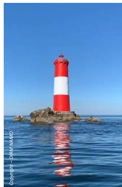
Phare des Cardinaux