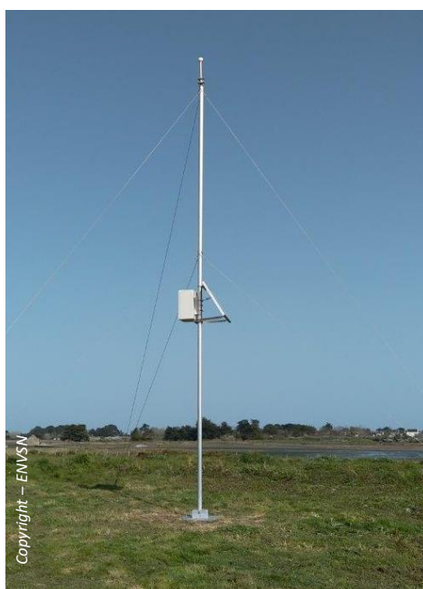
île d'Arz – Golfe du Morbihan